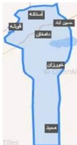
شکل ۱- محدوده مطالعاتی و موقعیت ایستگاه‌های مورد بررسی

شمال به استان‌های گلستان و مازندران، از جنوب به استان اصفهان، از شرق به شهرستان شاهرود و از غرب به شهرستان‌های سمنان و مهدی‌شهر منتهی می‌شود (شکل ۱). طول جغرافیایی شهرستان دامغان ۵۴ درجه و ۲۰ دقیقه و ۸ ثانیه و عرض جغرافیایی آن ۳۶ درجه و ۹