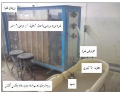
شکل ۲- مدل آزمایشگاهی در آزمایشگاه مکانیک خاک دانشگاه شهرکرد

پوشش‌دهی کانال، با تأکید بر تغذیه آب زیرزمینی با هدف برداشت دوباره، در منطقه بروجن استان چهارمحال و بختیاری مورد بررسی قرار بگیرد.