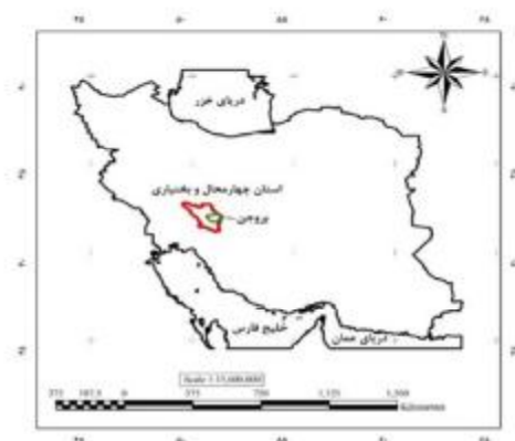
شکل ۱- نقشه محل قرارگیری شهرستان بروجن در استان چهارمحال و بختیاری

میزان نشت در آن انجام شد. بافت خاک به روش هیدرومتری تعیین شد (جدول ۲) و تا عمق سطح ایستابی که در ۶/۷۹ متری از سطح زمین قرار داشت، ثابت بود. برای ساخت مدل آزمایشگاهی، حدود ۲۰۰۰ کیلوگرم خاک از کانال به آزمایشگاه مکانیک خاک دانشگاه شهرکرد منتقل شد و آزمایش‌های بررسی نشت در فلوم این آزمایشگاه (مدل) انجام شد. خواننده گرامی برای اطلاع از جزئیات مدل آزمایشگاهی مورد استفاده و نحوه ایجاد آن به مقاله توکلی و همکاران (۱۳۹۵) ارجاع داده می‌شود.