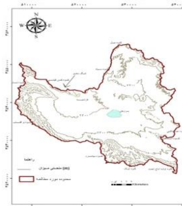
شکل ۱- نقشه توپوگرافی و موقعیت دشت بروجن - فردانیه

مقادیر کل نیاز آبی برآورد شده در سناریوهای مختلف برای سال‌های ۱۳۹۱ تا ۱۴۰۹ در جدول ۲ نشان داده شده است. نیاز آبی منطقه در سال ۱۴۰۹ نسبت به سال ۱۳۹۱ در سناریوهای مختلف افزایش یافته است. برای مثال مشاهده می‌شود که کل نیاز آبی در شرایط موجود (سناریوی S1) در سال ۱۳۹۱ برابر با ۱۱۷/۷ م.م.م و در سال ۱۴۰۹ مساوی ۱۲۰ م.م.م است. افزایش حدود ۲/۳ میلیون مترمکعبی نیاز در فاصله سال‌های ۱۳۹۱ تا ۱۴۰۹ به دلیل در نظر گرفتن شرایط توسعه صنعتی و افزایش جمعیت در طول این سال‌ها و در نتیجه افزایش نیاز شرب و صنعت است. سناریوهای S1 و S7 به ترتیب بیشترین و کمترین نیاز آبی را دارند. همچنین می‌توان مشاهده کرد که سناریوهای S6 و S7 بیشترین تأثیر را در کاهش نیاز آبی داشته‌اند. با توجه به اینکه نیاز آبی کل منطقه در شرایط موجود حدود ۱۲۰ م.م.م است، این میزان کاهش در مصارف آب بسیار قابل توجه است. گرفتن سناریوهای S4 و S5 (به ترتیب کاهش ۲۵ و ۵۰ درصدی سطح زیرکشت یونجه و سیب‌زمینی و جایگزینی آن‌ها با گندم آبی) سبب کاهش ۵/۸ و ۱۱/۷ م.م.م نیاز نسبت به